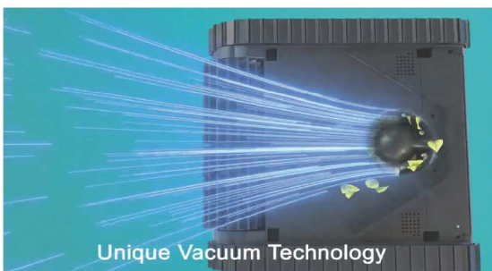
Unique Vacuum Technology