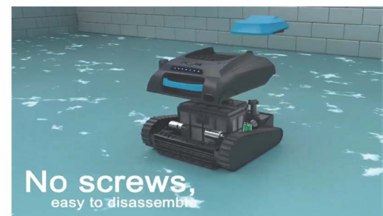
No screws, easy to disassemble