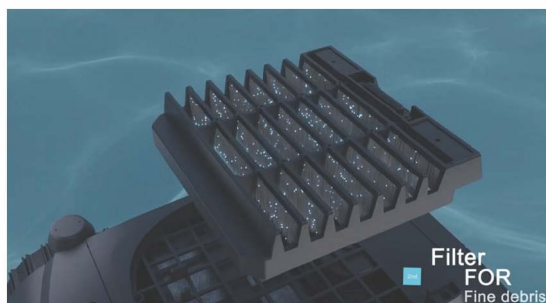
Filter FOR Fine debris